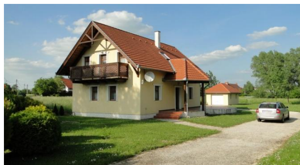
Huset i Kehidakustány

Pris: 15000 kr per vecka (dygnspriset blir för 4 personer 535 kr/dygn/person; för 6 personer 357 kr/dygn/person). I priset ingår: smörgåsbord frukost i Restaurang Favágó nära huset, fri Internet, satellit TV i varje rum, fria låncyklar för varje gäst, byte av sängkläder och handdukar var fjärde dag, svensk jourtelefon (vid behov) 24 timmar om dygnet, städning en gång i veckan (efter överenskommelse med gästerna så att Ni inte blir störda i onödan), välkomstpaket med kartor och för området speciellt framtagen reseguide på svenska, första dagen (dagen efter ankomst) gratis exkursion och orienteringstur i området och nära Balatonsjön inklusive lunch, middag och vinprovning, reseguider på svenska. Ägaren är svensktalande och hjälper Er att hitta rätt. Minsta uthyrningstiden: 1 vecka (7 nätter).