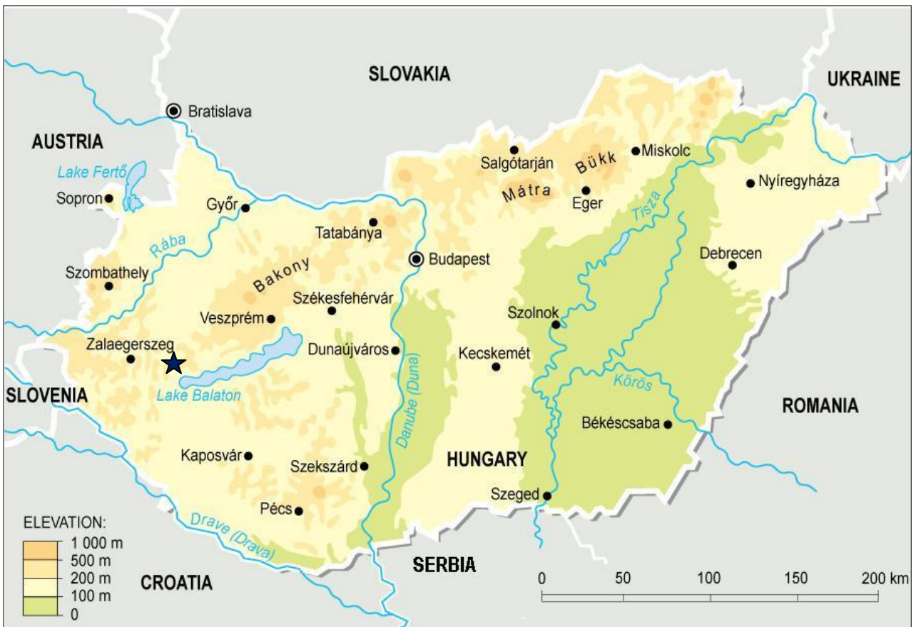
Ungern ★ = Kehidakustány