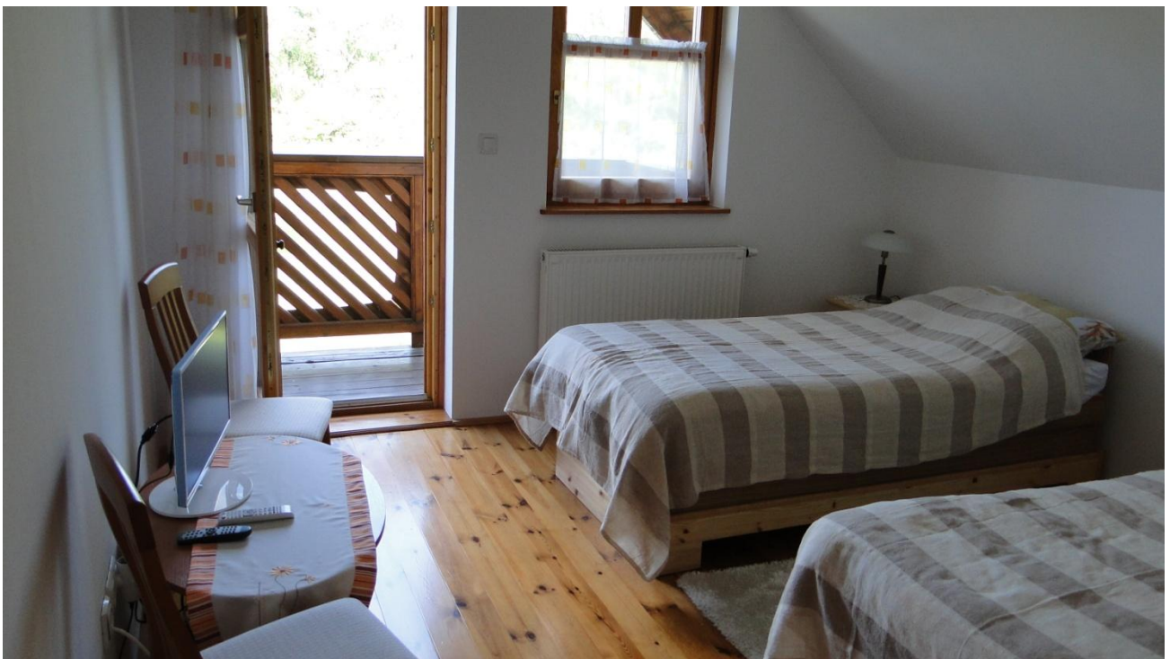
Sovrum med separata sängar