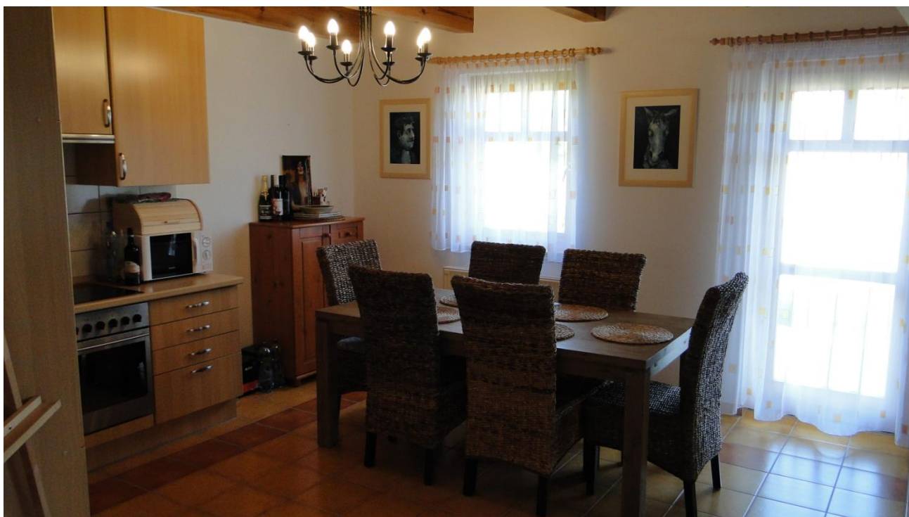
Kök med matplats för 6 - 8 personer (bordet är förstöringsbart)