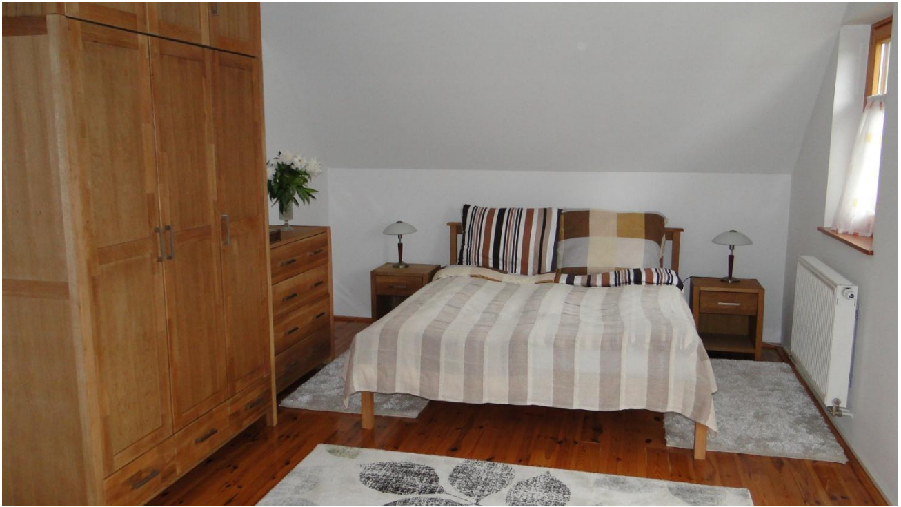
Sovrum med dubbelsäng