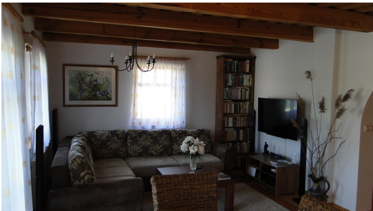
Vardagsrum med hemmabio