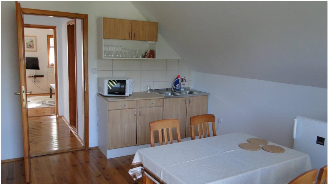
Tekök med matplats