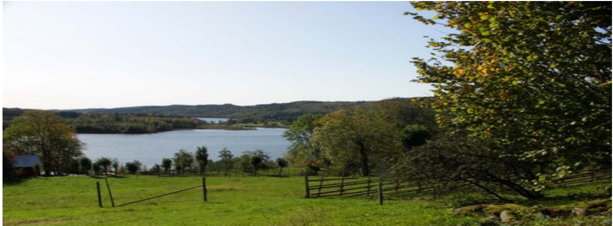
Bräcke Ängar, Dalsland

Dag 1 (31/5) : Det första stoppet blir i Dalsland vid Bräcke Ängar med sitt säregna växtsamhälle. Eftermiddagen ägnas åt Värmland och dess spännande geologi. Övernattning sker på Vårdshuset Lugnet i Malung där vi intar vår middag.