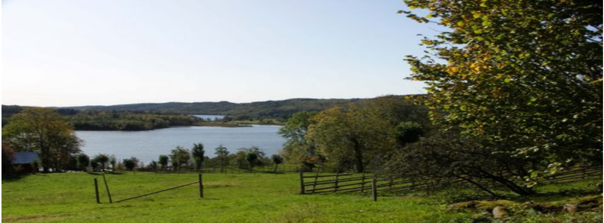
Bräcke Ängar, Dalsland

Dag 1 (29/5) : Det första stoppet blir i Dalsland vid Bräcke Ängar med sitt säregna växtsamhälle. Därefter äter vi lunch i Säffle. Eftermiddagen ägnas åt Värmland och dess spännande geologi. Övernattning sker på Vårdshuset Lugnet i Malung där vi intar vår middag .